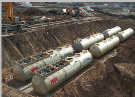
КОС ЭКО-Р-1000, ЖК "Цветы Башкирии", г. Уфа